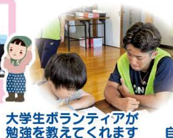
大学生ボランティアが勉強を教えてください