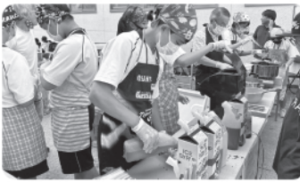
かき氷を提供しています