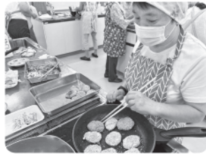
大根もちを調理中