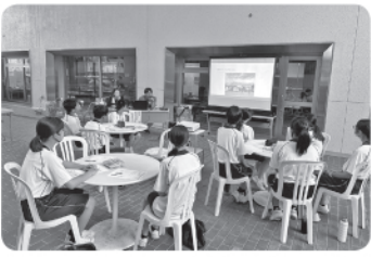
ボランティア基礎学習