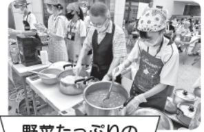
野菜たっぷりのカレーですよ～

今年度は、午前中にボランティアの基礎講座をし、「カフェなかにわ」とのコラボということで、中学生もカフェでボランティア体験をしました。地域のボランティアさんと一緒に活動をする事で、たくさんの学びがあったようです。 午後からは、地域で活躍する自分たちと年の近い学生ボランティアさんの体験談も聞き、より身近にボランティアが感じられたのではないかと思います。 夏休みの間に何度かボランティアとして参加してくれた中学生もいて、これから地域でボランティアとして活躍していく姿が目にかびます。期待していますね。