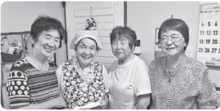
門田先生とサロン和合のメンバー