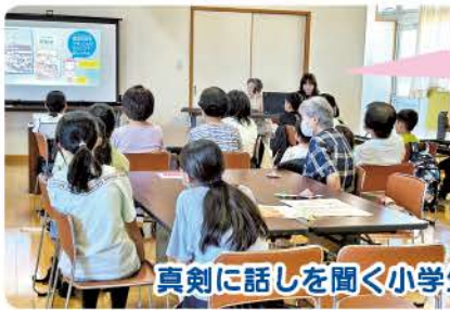
真剣に話を聞く小学生の皆さん