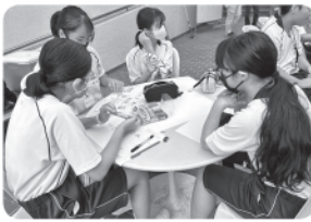
カフェのポップ作り