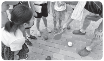
ボッチャのルールわかるかな?