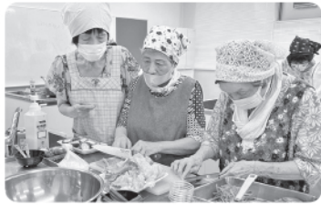
こんにやくを薄くするのが難しい